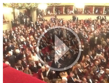
Prima della Scala, gli applausi e i buu...